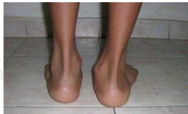
Figura 4A. Vista posterior de los pies de un paciente con coalición tarsiana en el pie derecho. Se puede observar valgo del retropié derecho.