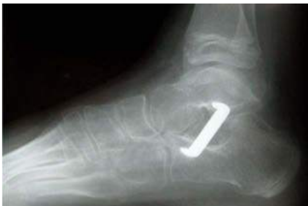
Figura 3B. Vista lateral del mismo pie dos meses post artroresis con grapa subastragalina y elongación del tendón de Aquiles, mostrando una gran mejoría en el ángulo astrágalo-primer metatarsiano (Ángulo de Meary).