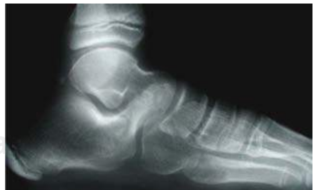
Figura 6B. Radiografía lateral con apoyo del pie izquierdo con una coalición calcáneo-escafoidea, en la cual se aprecia una prolongación anterior y superior del proceso anterior del calcáneo «Signo de la trompa del oso hormiguero».