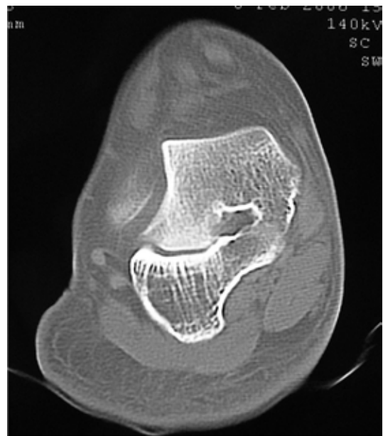
Figura 8. TAC. Corte coronal del retropié a nivel de la faceta medial, donde se observa la unión ósea entre el astrágalo y calcáneo.

de pie, AP (dorso plantar) y lateral de ambos pies con apoyo y radiografías oblicuas. En la proyección lateral se aprecia disminución del espacio de la articulación subastragalina (Figuras 5 A-B). En la coalición calcáneo-escafoidea se puede ver con frecuencia una prolongación anterior del calcáneo (Signo de la trompa del oso hormiguero (Figuras 6 A-B)). Las radiografías oblicuas del pie muestran bien la coalición calcáneo-escafoidea (Figura 7 A-B). La coalición subastragalina se puede valorar mejor con un TAC del retropié (Cortes coronales (Figura 8)). En algunos casos, es posible identificar una coalición subastragalina con una proyección axial del calcáneo, llamada también proyección de Harris.