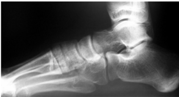
Figura 5A. Radiografía lateral con apoyo del pie izquierdo (sano).