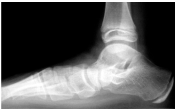
Figura 3A. Vista lateral de un pie plano flexible, con tendón de Aquiles corto y dolor persistente. Preoperatorio.

nal, generalmente asociados a valgo marcado del retropié, se recomienda tratamiento quirúrgico. La cirugía más comúnmente recomendada en la literatura consiste en una osteotomía de elongación del cuello del calcáneo, utilizando un injerto óseo tricortical de la cresta iliaca del paciente o del banco de hueso, plicatura de las estructuras mediales del pie y elongación del tendón de Aquiles (Técnica de Evans modificada por Mosca). Otra opción es la osteotomía de deslizamiento medial del calcáneo, descrita por Koutsogiannis. Se han utilizado también Grapas o Espaciadores Subastragalinos de forma temporal para «elevar» el arco longitudinal del pie y aliviar los síntomas (Figuras 3 A-C). Sin embargo, es importante recordar que la cirugía se reserva solamente para los casos con dolor persistente.