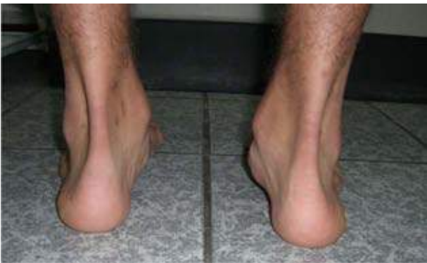
Figura 9B. Vista posterior de ambos pies, donde se muestra la prominencia medial en el área del escafoides, asociada a valgo del retropié.

contrario, o en casos muy avanzados o severos, se recomienda la artrodesis subastragalina, llevando el retropié a neutro.