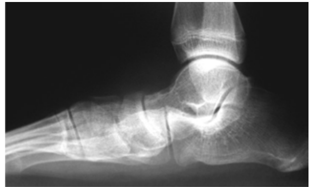
Figura 5B. Radiografía lateral con apoyo del pie derecho, donde se aprecia disminución del espacio de la articulación subastragalina, en el pie con coalición tarsiana. Además se aprecia verticalización del astrágalo y horizontalización (equino) del calcáneo.