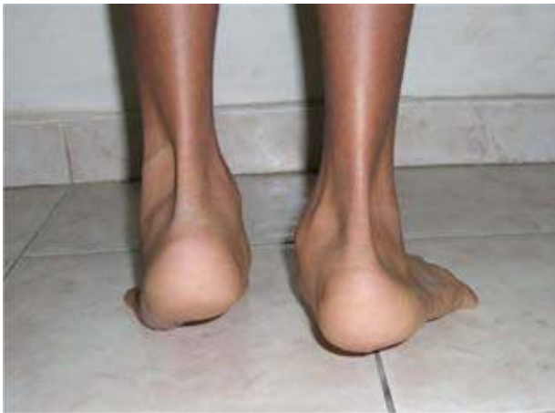
Figura 4B. Vista posterior del mismo paciente, al pararse de puntas. Donde se aprecia que el retropié izquierdo se invierte (movilidad de la subastragalina normal) y el retropié derecho se mantiene en valgo (anormal; signo de rigidez de la articulación subastragalina).

Clínicamente el dato más común es un pie plano valgoso doloroso. Con limitación dolorosa de la movilidad