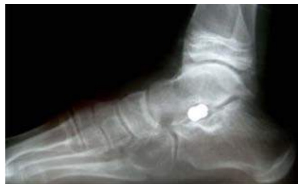
Figura 3C. Vista lateral de un pie plano flexible unilateral (con dolor persistente) manejado con un implante subastragalino.