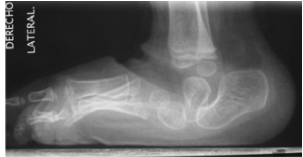
Figura 10. Radiografía lateral con apoyo de un pie con astrágalo vertical congénito. Se puede ver la orientación vertical del astrágalo, siguiendo el eje de la tibia. Además de severo equino del calcáneo.

Clínicamente se caracteriza por una masa o aumento de volumen firme y doloroso en el borde inter-