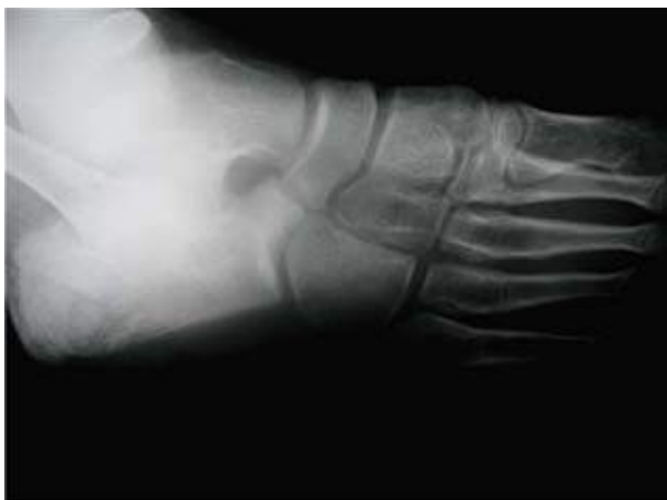
Figura 7B. Radiografía oblicua del pie izquierdo con una coalición calcáneo-escafoidea. Donde se aprecia la prolongación del proceso anterior del calcáneo y su unión fibrosa con el escafoides.