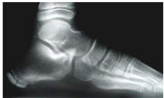
Figura 6A. Radiografía lateral con apoyo del pie derecho normal.