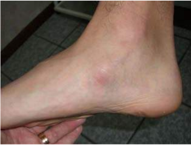
Figura 9A. Vista medial del pie, mostrando la prominencia enrojecida y dolorosa en el medio pie en el área del escafoides.